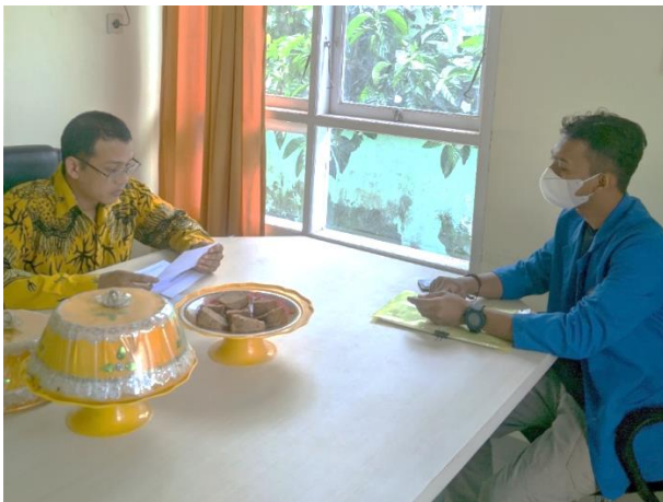
Wawancara dengan Pengurus UPZ Biringere