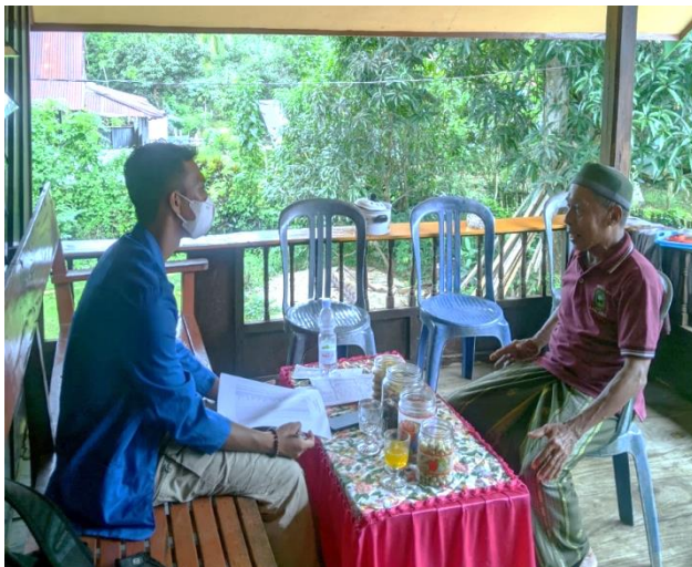
Wawancara dengan Pengurus UPZ Alehanuae