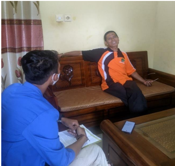
Wawancara dengan Pengurus UPZ Bongki