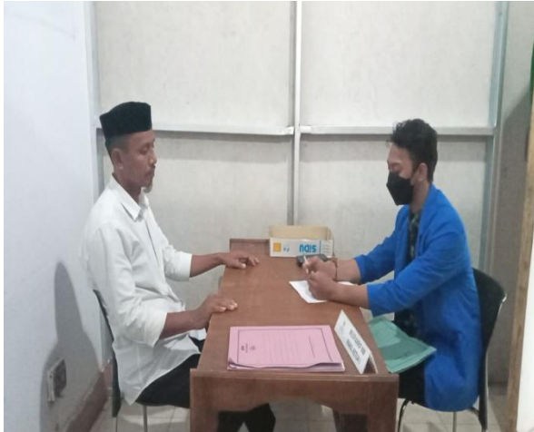
Wawancara dengan Ketua BAZNAS Kabupaten Sinjai