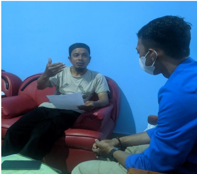
Wawancara dengan Pengurus UPZ Balangnipa