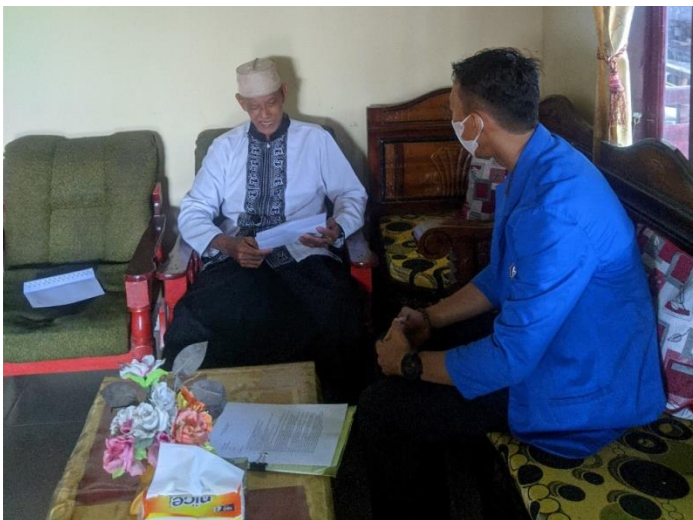
Wawancara dengan Pengurus UPZ Lappa