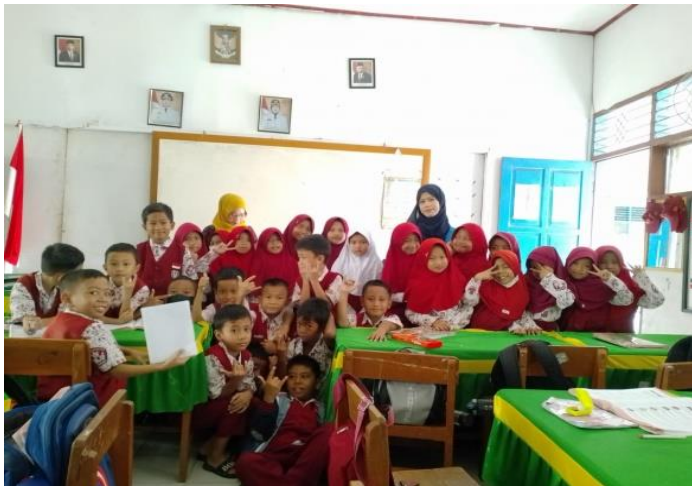
Bersama guru wali kelas II dan foto bersama siswa dan guru kelas II