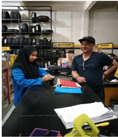
Wawancara pemilik Toko Alam Jaya