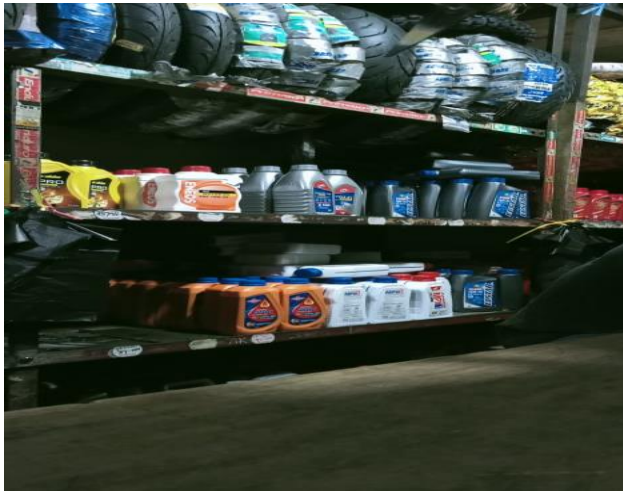
Barang Dagang di Toko Alam Jaya