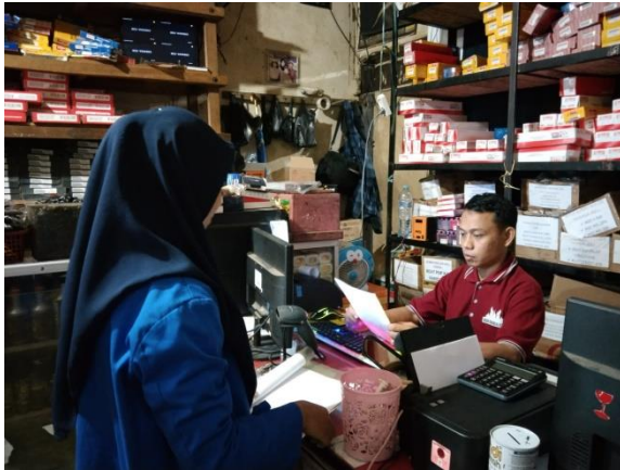
Wawancara kepada pegawai Toko Alam Jaya Nota Penerimaan Barang Bulan Juli 2023