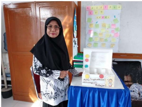
Gambar 4 Media Pembelajaran Lalu lintas