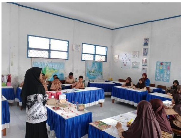
Gambar 3 Proses Pembelajaran