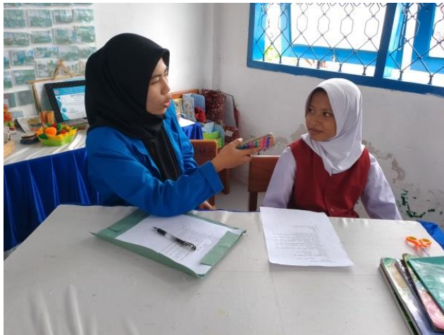
Gambar 2 Wawancara dengan Peserta didik Kelas V