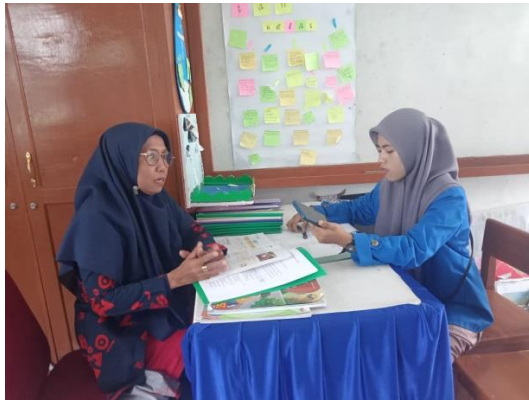
Gambar 1 Wawancara dengan Wali Kelas V