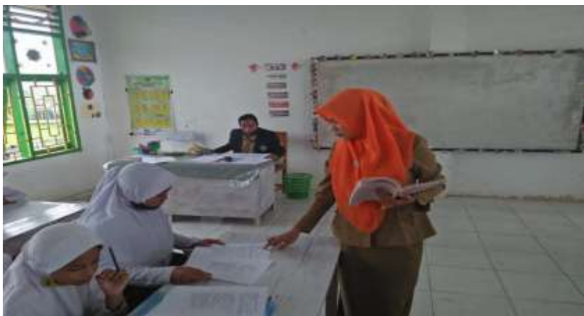
Dokumentasi Pembelajaran di Kelas