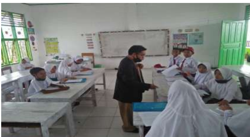
Dokumentasi Penelitian di Kelas