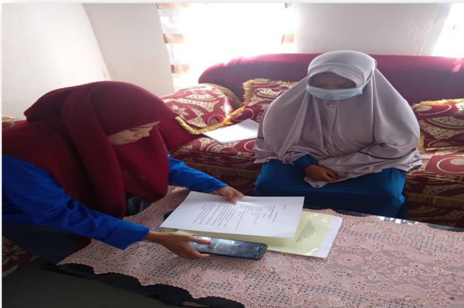
Gambar : Dengan Proses Pembelajaran PAI pada Tanggal ( 15 Juni 2022)