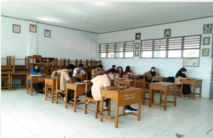
Gambar : Dokumentasi Akhir Proses pembelajaran dan baground sekolah