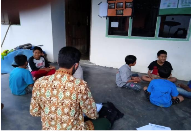
Konseli melakukan diskusi dan pengerjaan tugas