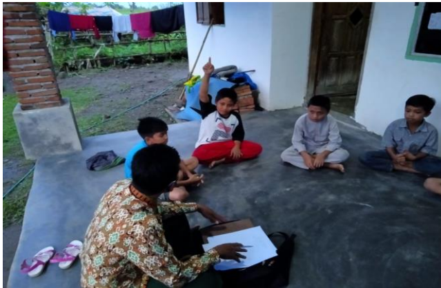
Memberikan refleksi dan penguatan