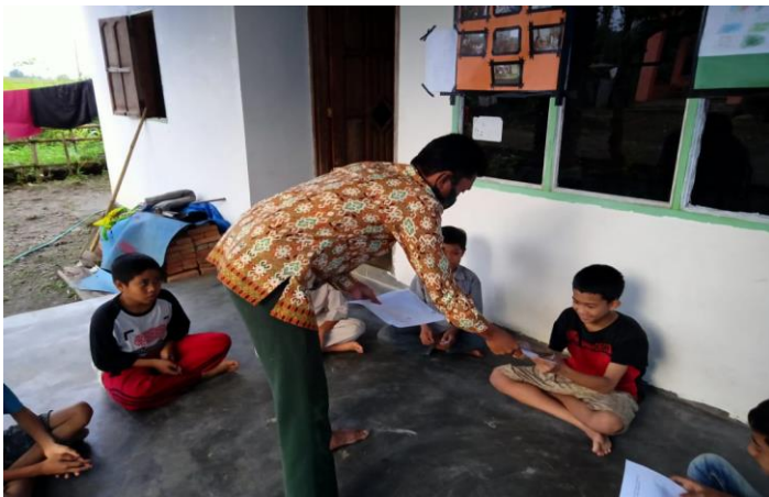
Pembagian angket Pre-Test Konseli mengerjakan angket