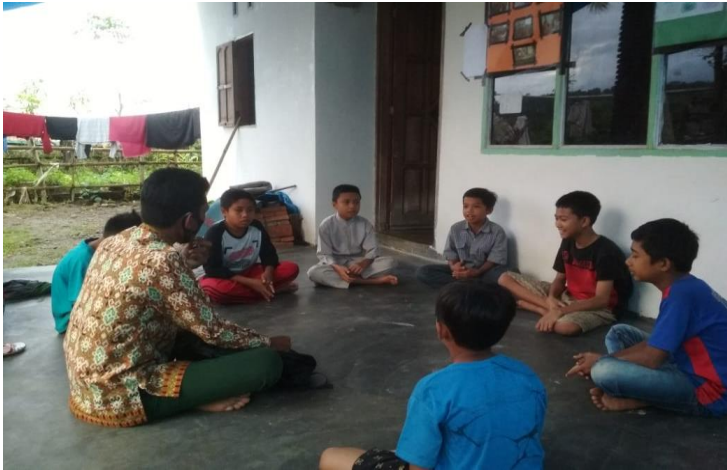
Tahap awal kegiatan