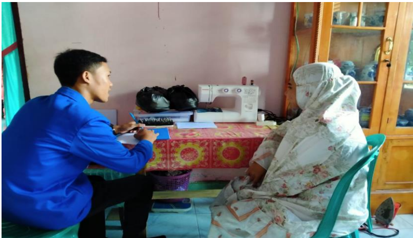
Dokumentasi dengan Anggota PKK Desa Patalassang