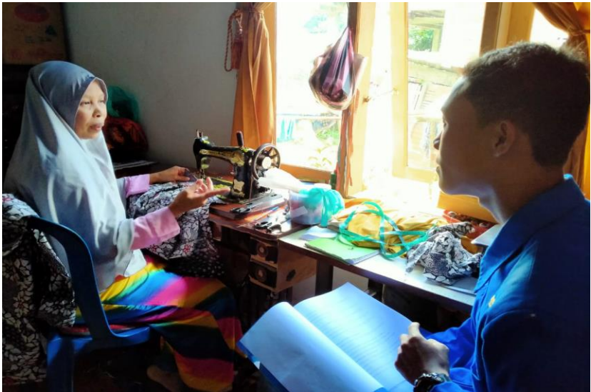
Dokumentasi dengan Anggota PKK Desa Patalassang