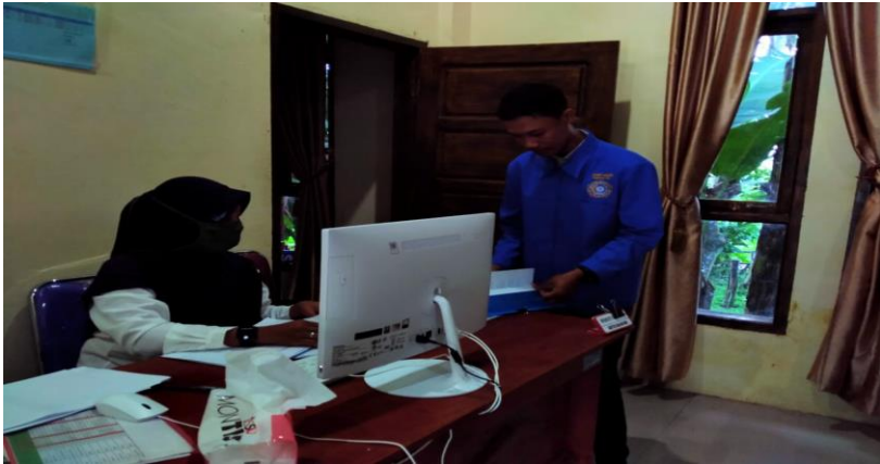
Dokumentasi dengan Ketua PKK Desa Patalassang