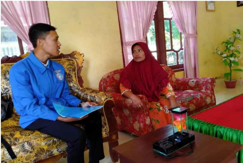
Dokumentasi dengan Masyarakat Desa Patalassang