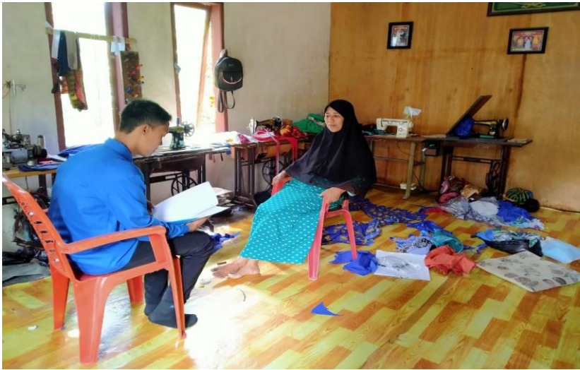
Dokumentasi dengan Anggota PKK Desa Patalassang