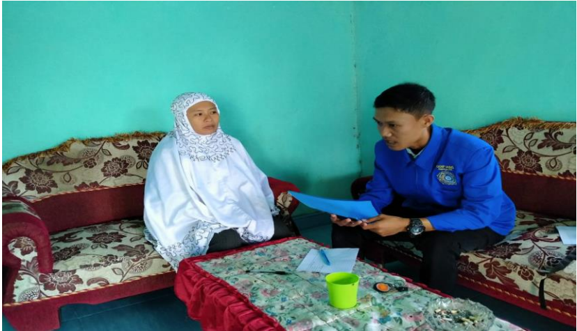
Dokumentasi dengan Anggota PKK Desa Patalassang